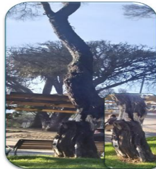
Acacia Melanoxyton N° 03 calle Providencia Dirección norte-sur

Inclinación que tiene con el viento que viene del pacifico hacía la cordillera están todos hacía la pérgola que se hizo, debajo de la pérgola hay escaños, transita mucha gente hay un paso peatonal y eso a la larga es un peligro latente mi recomendación como profesional y la experiencia me lo dice yo creo que el municipio debiera extraerlos lo antes posible yo en mi informe di un plazo de 45 días y más menos lo que se podría hacer y ojala como recomendación hacerlo en forma nocturna ¿Por qué? Porque se trata de un área verde que hace un entorno paisajístico a la comuna de San Antonio tengo entendido que últimamente es la plaza que más se usa para hacer eventos.