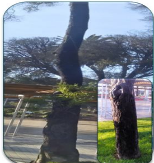
Acacia Melanoxyton N° 01, calle Providencia Dirección norte-sur