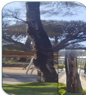
Acacia Melanoxyton N° 02, calle Providencia Dirección norte-sur