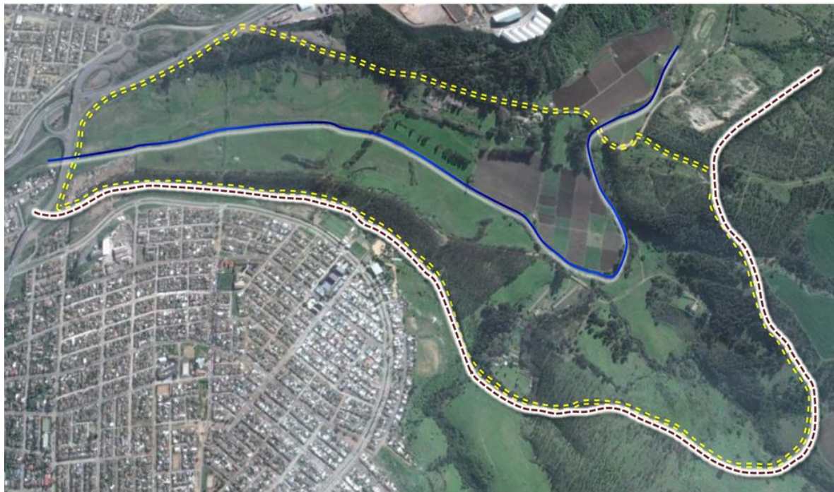
Simbología : Amarillo --- Deslinde predio total 130 Há Café-blanco - - - Línea férrea. Azul Estero El Sauce.