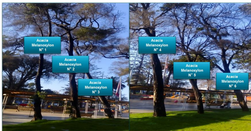
Ubicación de las especies, costado calle Providencia entre Del Canelo y Francia, dirección Norte - Sur de la Plaza Bernardo O'Higgins

Pérgola ahí hay escaños hay gente que transita eso es un peligro latente hacia la gente que puede estar se hacen además eventos y los fines de semana hay niños y mucha gente y eso en cualquier momento se puede tumbar no le puedo decir mañana o pasado pero están en un 80% necrosos, muertos